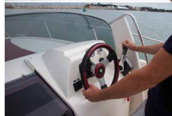
La position de conduite de l'Abaco 22 se révèle ergonomique et sans reproche.

La petite cabine permettra d'envisager une navigation d'une nuit ou deux.