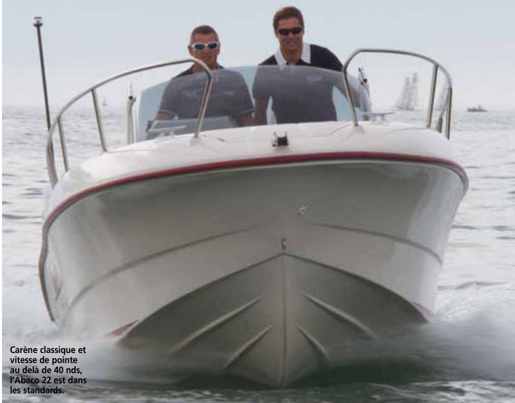
Carène classique et vitesse de pointe au delà de 40 nds, l'Abaco 22 est dans les standards.

L'Abaco 22 est un bateau familial par excellence dans son aménagement mais ce sentiment se vérifie également sur l'eau. Le bateau de notre essai est équipé d'un V6 200 ch Suzuki, moteur dont les éloges ne sont plus à faire. Souple et discret, il sait aussi se montrer réactif. Les sensations sont très agréables. La carène est des plus classiques : bouchains vifs sur toute la longueur, complétés de deux virures. Les réactions sont saines et ne souffrent d'aucun défaut décelable dans ces conditions. La gîte dans les virages se révèle très raisonnable et contribue au sentiment de sécurité qui émane de cette unité. L'Abaco 22 répond parfaitement à nos attentes sur un plan d'eau qui, il faut dire, fut particulièrement calme durant cet essai. Le déjaugage s'obtient en moins de 3 secondes et il faut 6 secondes pour afficher 30 nds. Nous avons accroché 40,2 nds, mais le montage que nous avons utilisé a été revu depuis par le staff de chez Suzuki afin d'obtenir une meilleure allonge. Il faut compter sur 42 nds en vitesse de pointe. Côté poste de pilotage, la poignée est protégée par le carénage qui borde la console. C'est un détail qui permettra notamment d'éviter d'accrocher la poignée accidentellement. Le volant est très vertical, mais dispose d'un grip de qualité. La planche de bord